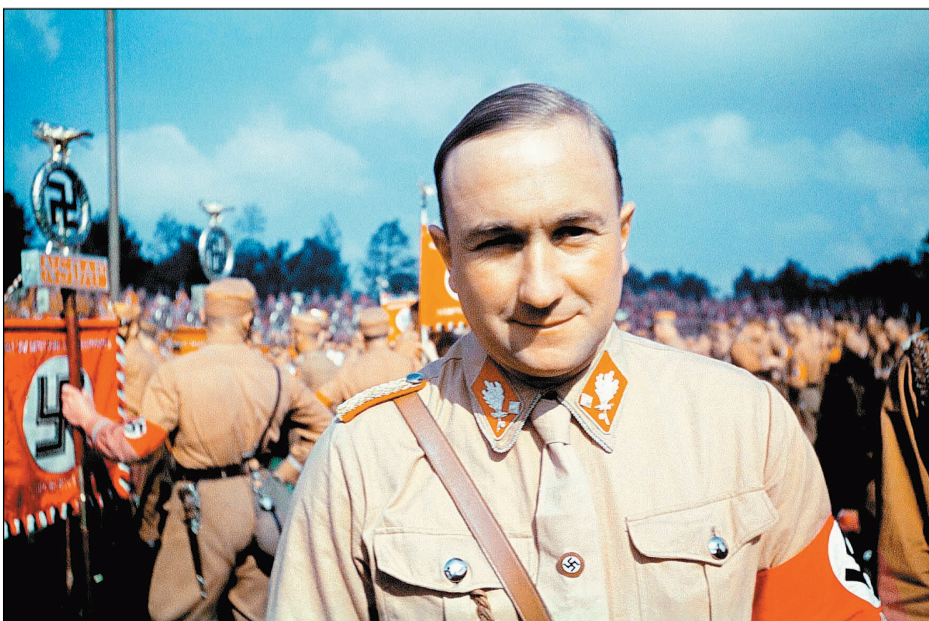
Záber z filmu Dve či tri veci, ktoré o ňom viem.