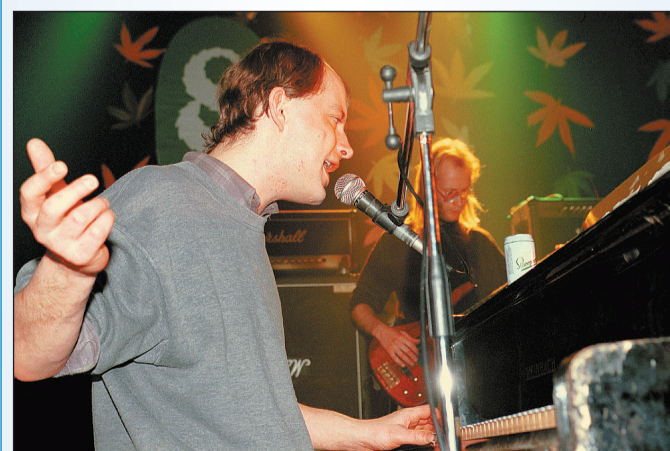
Jednou z mála možností, ako vidieť slávnú českú alternatívnu kapelu okolo hudobníka a básnika Filipa Topola na Slovensku, ponúka Fest fiesta pri Senici, kde sa Psi vojáci predstavujú dnes o 21.00 h.

www.countrymlyn.sk , www.festivalsigord.sk , www.infernofest.sk , www.susedi.sk